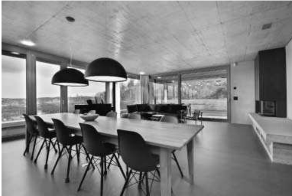
Sichtbeton - Einfamilienhaus Biberstein