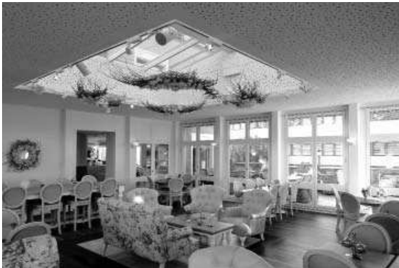
Restaurant - Umbau/Anbau , Suhr

Umbau „Café Pöstli“ zu Fairyhouse by Törtlifée“ 2017 / 2018